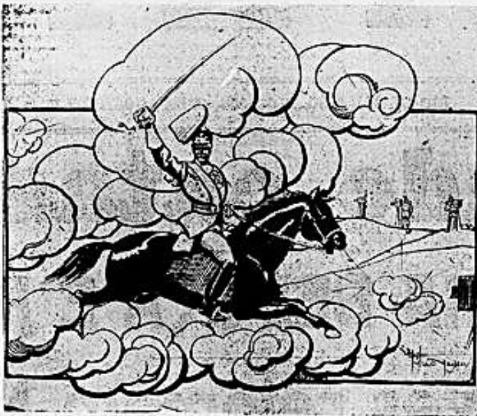
— Soldado, o cinema vos contempla!

emissão, como affirmou o Sr. Irineu Machado, accusando o chefe do Partido Conservador de intolerante e despotico no rigor excessivo da disciplina partidária, pois chegou esta folha a declarar que comprehendia que, por escrupulo de consciencia, S. Ex. votasse contra a medida. O que não podia fazer o digno presidente da commissão de finanças era, a pretexto de justificar o seu voto, escrever uma caulinaria contra a actual administração da pasta da fazenda, endossando calumnias e accusações sem base, já rebeldias quando exploradas pela opposição, procedimento que não se explica nem honrem da sua respeitabilidade, nem seu caracter e da sua significação politica.