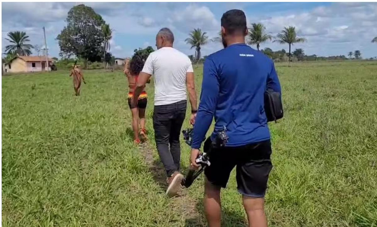
Série 'Terras em Guerra' revisita assassinatos de indígenas em conflitos por território no terceiro episódio

Já na quinta e última reportagem da série, exibida na sexta-feira (13), os jornalistas da TV Bahia abordaram como a atuação do tráfico de drogas dentro das aldeias tem intensificado a violência na região. Em algumas aldeias, como no caso de Xandó, o tráfico tem cooptado jovens indígenas, ameaçado lideranças, expulsado pessoas e matado quem se opõe a ação de traficantes.