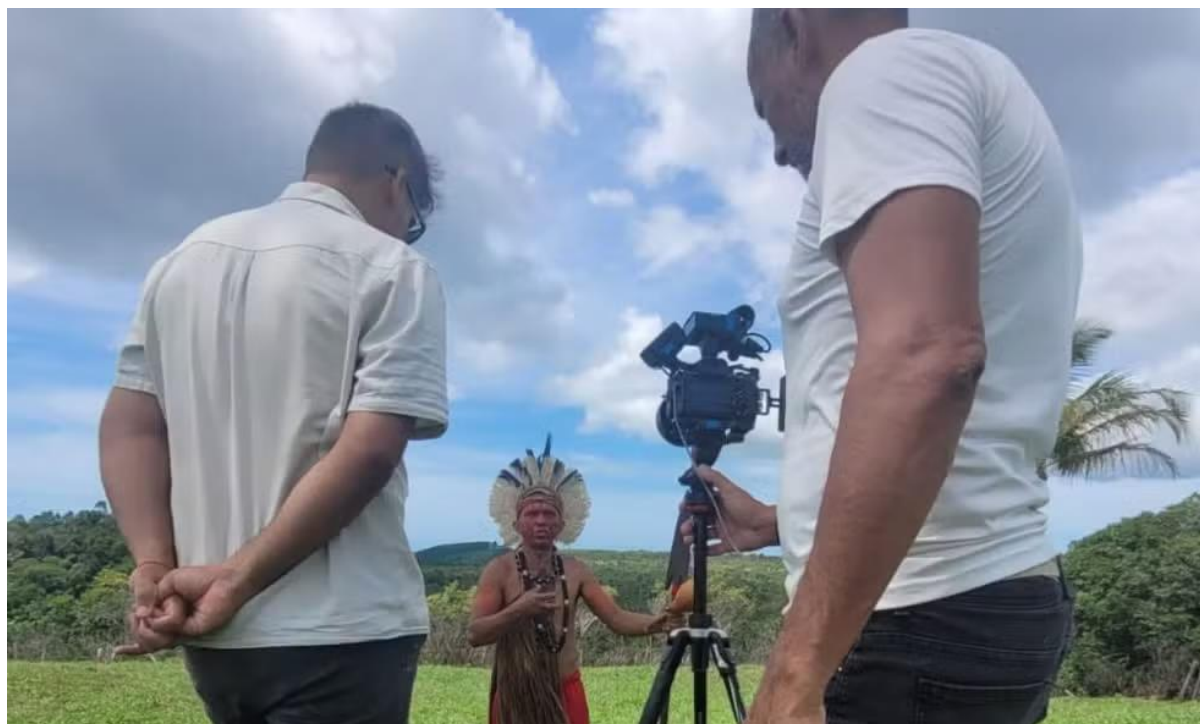
terras em guerra — Foto: Rede Bahia

Os conflitos entre indígenas e produtores rurais no sul e extremo sul da Bahia foram tema da série de reportagens especiais "Terras em Guerra" .