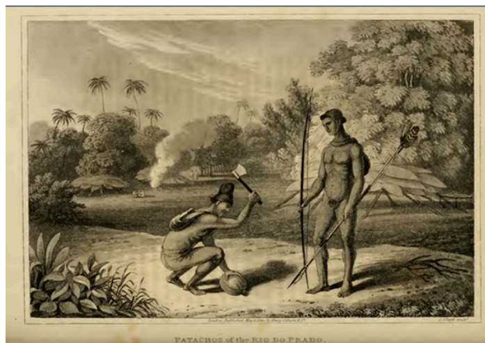
Figura 3: ilustração de Maximilian de Wied-Neuwied - Fonte: WIED MAXIMILIAN, Prinz Von. Viagem ao Brasil . Tradução de Edgar S. de Mendonça e Flávio P. de Figueiredo. Belo Horizonte: Itatiaia; São Paulo: Editora da USP, 1989. p. 241.

Também em relação a aparência física, afirma semelhanças externas aos Puris e aos Maxakalis, sendo, porém, mais altos. Os homens da etnia carregavam suas facas presas em um cordão no pescoço e penduravam os terços da mesma maneira. Sua tonalidade de pele era marrom avermelhado naturalmente (Wied-Neuwied, 1989 [1820], p. 214-215). A seguir apresento uma das práticas de abrir o côco com um machado e os grandes arcos representativos dos Pataxó, que mediam entre dois metros e meio e podiam chegar a pesar 3kg (Métraux, Nimuendaju, 1946, p. 543).