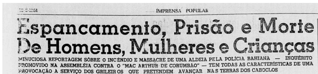
Figura 7: Manchete do jornal Imprensa Popular. Fonte: Imprensa Popular , 19 de junho de 1951. Disponível em: https://memoria.bn.gov.br/docreader/DocReader.aspx?bib=108081&pagfis=782 . Acesso em: 26/09/2024.