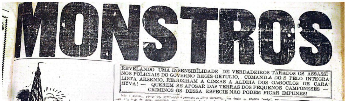
Figura 9: Manchete do jornal O Momento

O periódico A Tarde partilhava do mesmo discurso inicial acerca de luta armada: “A repressão policial aos bandoleiros que, em nutrido grupo, causam pânico no interior deste município começou a 25 do corrente quando a patrulha punitiva conseguiu a sua primeira vitória” ( A Tarde , 29/05/1951). Porém, é de conhecimento que o único embate justo travado se deu entre os dois destacamentos policiais que trocaram tiros de fuzis por quase uma hora acreditando que estavam combatendo os indígenas. O jornal A Tarde (01/06/1951) afirma: “Infelizmente, devido à falta de um plano articulado entre a polícia de Porto Seguro e a de Prado, os bandidos conseguiram escapar enquanto as duas forças se atiravam”, confirmando um fogo cruzado entre os dois destacamentos policiais. Por fim, o jornal Imprensa Popular relata