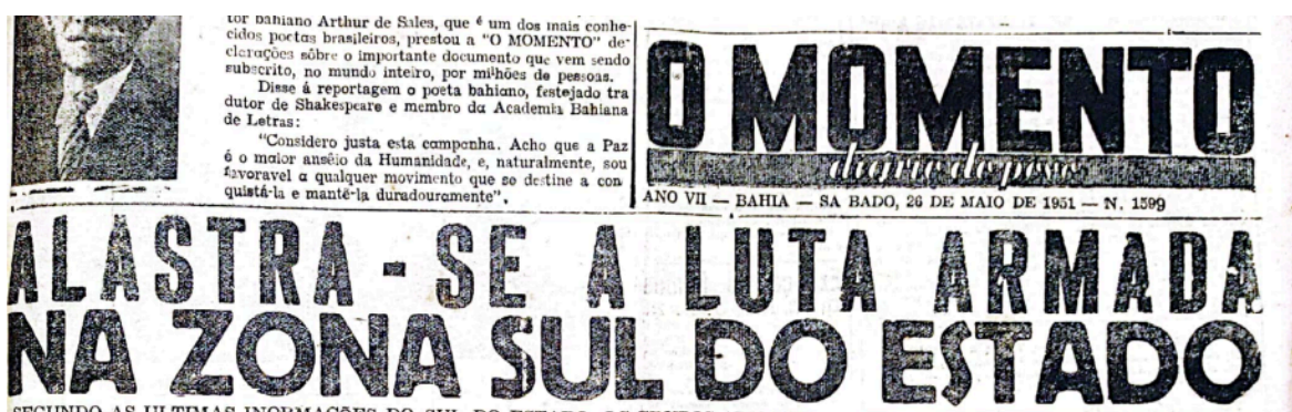
Figura 8: manchete do jornal O Momento

Ao comparar os ataques no sul da Bahia com a Guerra da Coreia, observa-se a gravidade com que o jornal aborda os eventos. As reportagens, extremamente violentas, buscam conscientizar os leitores sobre o horror que assolou a região. As primeiras edições do jornal O Momento (26 e 27 de maio) destacam o choque causado por essas ações violentas e ajudam a disseminar a ideia de uma luta armada de grande escala, relatando a presença de duas centenas de homens armados, como demonstra na manchete a seguir ( O Momento , 27/05/1951).