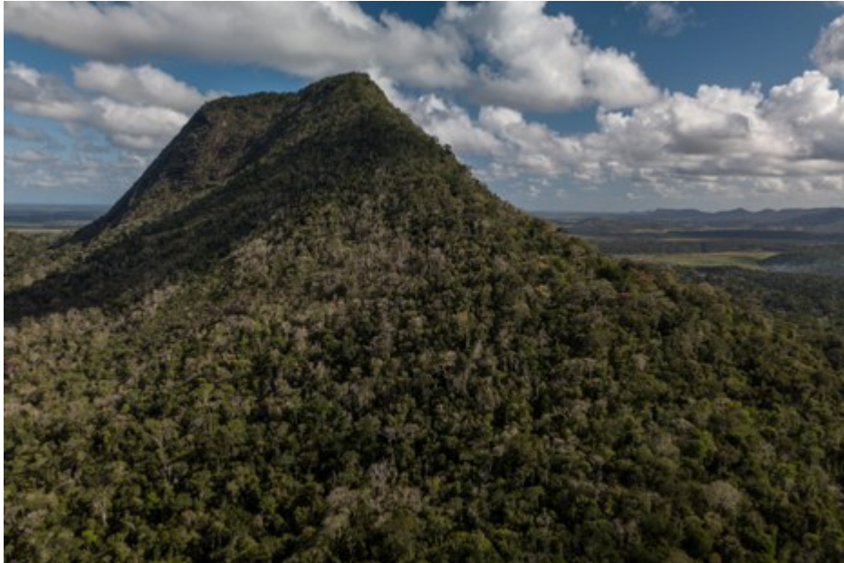
Figura 5: Monte Pascoal - Fonte: Ministério do Meio Ambiente. Disponível em: https://www.gov.br/icmbio/pt-br/assuntos/biodiversidade/unidade-de-conservacao/unidades-de-biomas/mata-atlantica/lista-de-ucs/parna-e-historico-do-monte-pascoal/informacoes-sobre-visitacao-parna-e-historico-do-monte-pascoal . Acesso em: 26/09/2024.

prerrogativa resultou no tombamento de algumas áreas na cidade no Rio de Janeiro (Scifoni, 2003) e, na década de 1940 possibilitou a iniciativa de tombamento do Monte Pascoal e seu entorno como área de preservação ambiental e símbolo nacional (Pereira, 2012, p. 45).