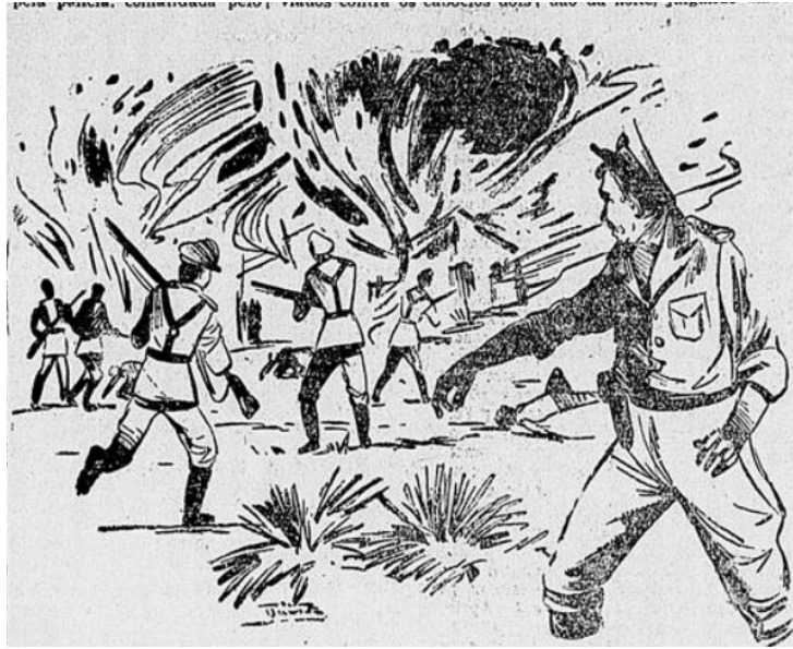
Figura 6: ilustração do Fogo de 51 - Fonte: Imprensa Popular , 19 de junho de 1951. Disponível em: https://memoria.bn.gov.br/docreader/DocReader.aspx?bib=108081&pagfis=782 . Acesso em: 26/09/2024.