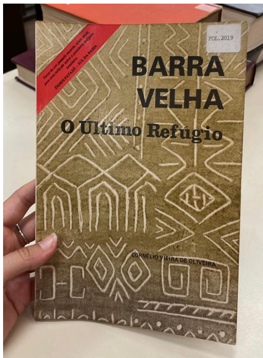
Figura 1: obra Barra Velha: o último refúgio

Frente a diversos movimentos de retorno e de expulsão ao Monte Pascoal e 17 anos após o Fogo de 51 , os indígenas cederam relatos à Cornélio Vieira de Oliveira para a construção da obra Barra Velha: o último refúgio , a fonte principal desta pesquisa. O primeiro contato com este livro deu-se em uma pesquisa realizada no acervo virtual da Associação Nacional de Ação Indigenista (ANAÍ), em meio a um levantamento de possíveis fontes que se preocupassem com a perspectiva indígena acerca do Fogo. Me deparei com uma obra escrita pelo sertanista, com o documento datado de 1978 e nomeado em homenagem àquela comunidade. Trata-se de uma versão anterior lida aos indígenas a fim de receber sua aprovação (Vieira Oliveira, 1978), e a publicação oficial ocorreu somente em 1985. Possuindo muitas folhas rasuradas, marcadas e danificadas, a completa análise do livro ocorreu graças à versão publicada de 1985, encontrada na biblioteca do Museu de Etnologia e Arqueologia (MAE) da Universidade de São Paulo (USP):