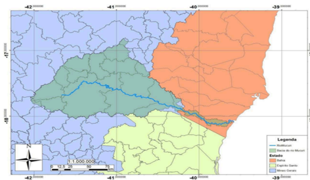
Figura 2: Mapa hidrográfico da região sudeste - Fonte: ALMEIDA, Rafael A. Moldagem Hidrológica na bacia do Rio Mucuri com a utilização do modelo swat . 2016. Tese (Pós-graduação) – Engenharia Agrícola, Universidade Federal de Viçosa. Viçosa, p. 20. 2016.

A nomenclatura Pataxó, Patachó ou Patashó 2 é utilizada para designar um grupo indígena que habitou e habita a região da bacia hidrográfica do rio Mucuri. Tal bacia situa-se nas regiões Sudeste e Nordeste do território brasileiro, englobando estados como: Minas Gerais, Espírito Santo e Bahia. O Norte do Espírito Santo, com destaque para os municípios de São Mateus e Itaúnas, são banhados por esse rio como demonstra o mapa a seguir (IGHAM, 2011).