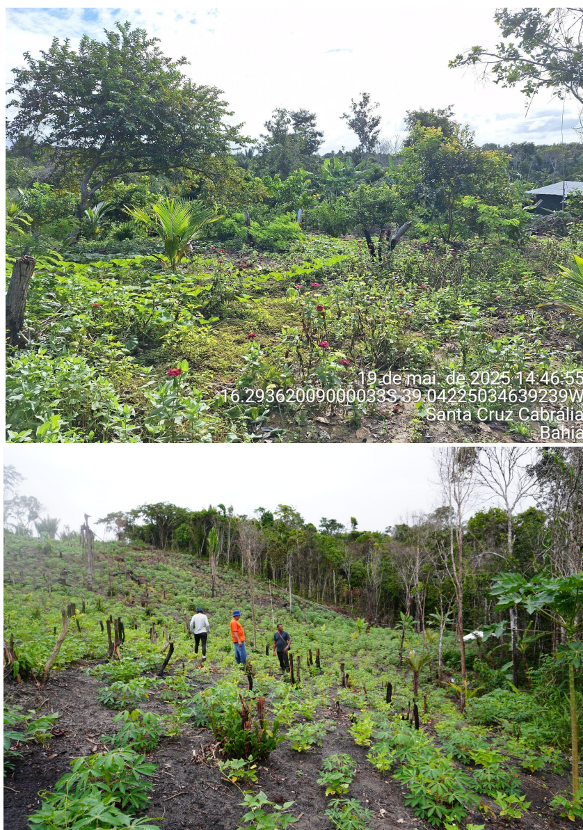
Figura 6: Plantio agrícolas realizados pela comunidade. Ref. 19 mai. e 06 jun. 2025.

A comunidade possui acesso à rede elétrica, com instalação de padrões individuais em andamento em todas as 120 casas. Aproximadamente 30 casas são de alvenaria, e outras foram construídas com materiais como barro, piaçava, pau-a-pique e retalhos de eucalipto. A água é obtida por meio de poços artesanais (cacimbas), caminhão-pipa e armazenamento de água da chuva. O poço artesiano já foi cavado pelo governo estadual, mas ainda não está em funcionamento, aguardando a obra de instalação e distribuição da água. O esgotamento sanitário é feito principalmente por fossas rudimentares, revestidas com alvenaria. A coleta de lixo ocorre regularmente, embora de forma concentrada em pontos específicos da aldeia.