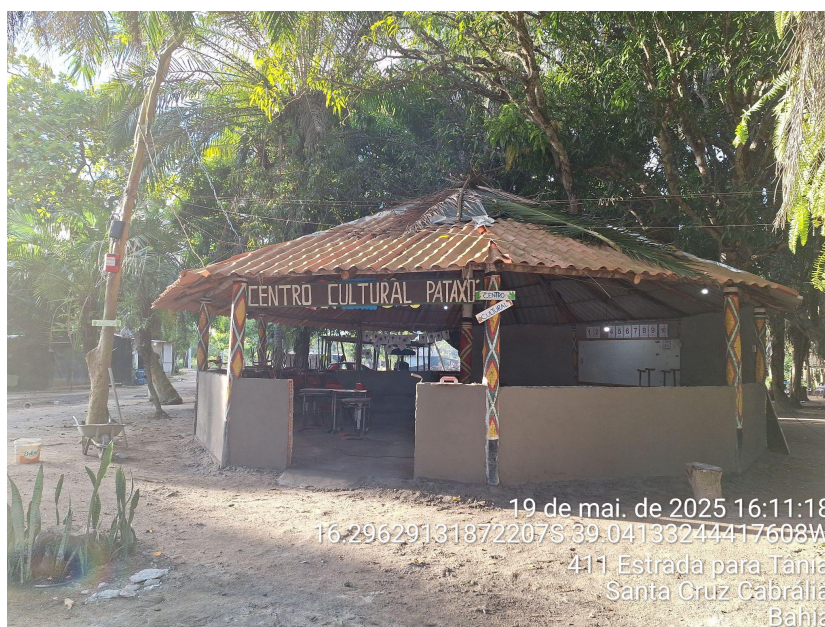
Figura 7: Centro Cultural Pataxó, dentro da aldeia Nova Canaã. Ref. 19 mai. 2025.

Há presença de uma Casa de Oração e de um Centro Cultural Pataxó, que, atualmente, também recebe a escola e é utilizado para a realização de rituais tradicionais e outras reuniões. Outras estruturas estão em construção para receber os rituais realizados na aldeia.