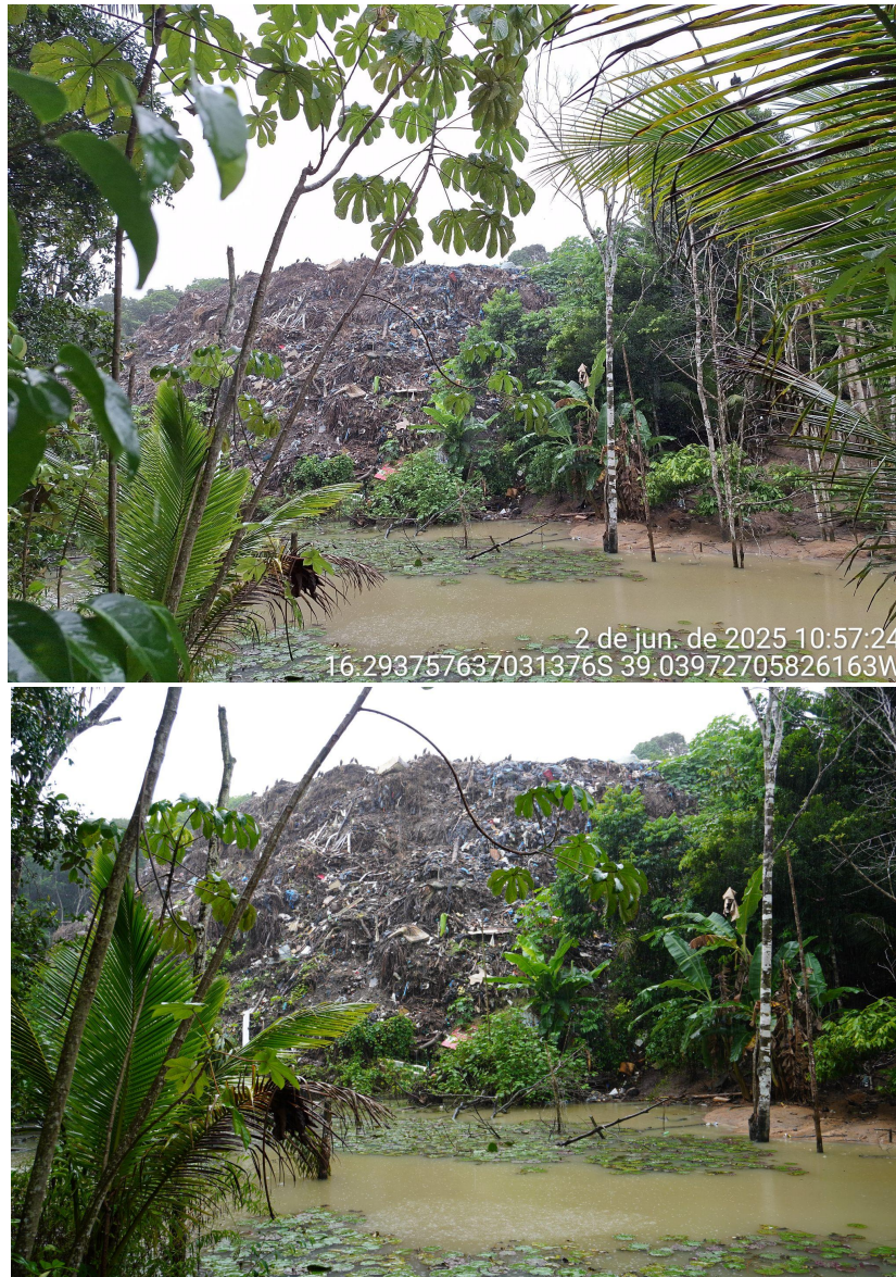
Figura 5: Registros da área de depósito irregular de lixo nos entornos da aldeia Nova Canaã, em área adjacente ao bairro Terra de Vera Cruz. Ref. 06 jun. 2025.

Foram identificados empreendimentos não-indígenas no entorno do território, principalmente devido aos bairros periurbanos com atividades comerciais. Dentro da aldeia não há empreendimentos de não-indígenas. A comunidade possui pequenos comércios (mercadinhos), produção de artesanato e possuem um projeto de etnoturismo em fase de implementação em seu território.