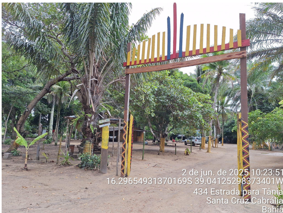
Figura 4: Fotos gerais da Aldeia Nova Canaã. Ref. 06 jun. 2025.

O território foi retomado há dois anos, e sua situação administrativa ainda se encontra sem delimitação formal por parte dos órgãos competentes. A comunidade passou por tentativa de reintegração de posse, receberam liminar da justiça para se retirarem, mas não chegaram a desocupar a área. Na época, a juíza local encaminhou o caso para o âmbito federal que, ao verificar, não deu prosseguimento ao processo. Ainda, segundo as lideranças, proprietários particulares continuam reivindicando a posse da terra, mas sem apresentar a documentação que comprove a posse. Apesar da ausência de conflitos recentes, há registros de tentativas de expulsão por meio de ofertas financeiras e ameaças veladas, sobretudo no início da retomada.