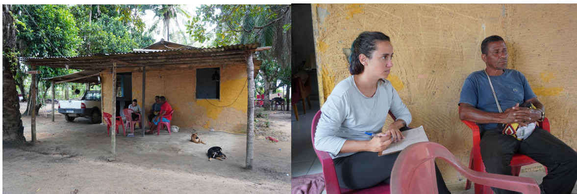
Figura 2: Entrevista realizada com as lideranças da aldeia Nova Canaã. Ref. 02 jun. 2025.

A segunda visita aconteceu em 02 de junho de 2025, quando foi realizada a aplicação do questionário (Figura 2). O questionário foi aplicado junto ao cacique da aldeia e uma de suas lideranças, e contempla os seguintes temas: perfil da população, caracterização do território, sobreposições territoriais, empreendimentos, direitos sociais (saneamento básico, moradia, educação, saúde), assistência social, intolerância religiosa e segurança. A aplicação da entrevista foi gravada para auxiliar no processo de sistematização das informações coletadas. A transcrição da entrevista encontra-se no anexo B.