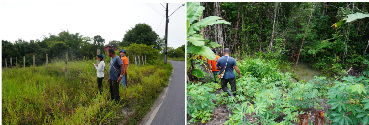
Figura 3: Equipe em campo durante o mapeamento dos limites da aldeia Nova Canaã. Ref. 02 jun. 2025.