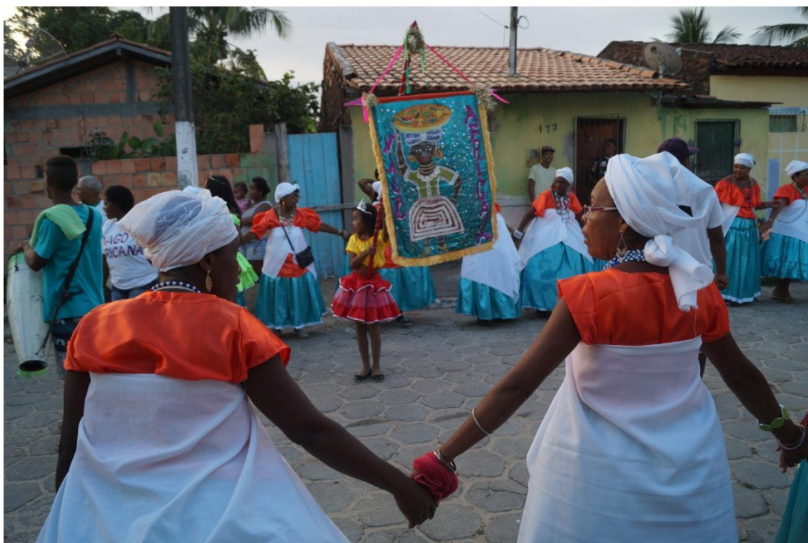
Imagem 1: Organização do desfile para a saída no carnaval de 2018