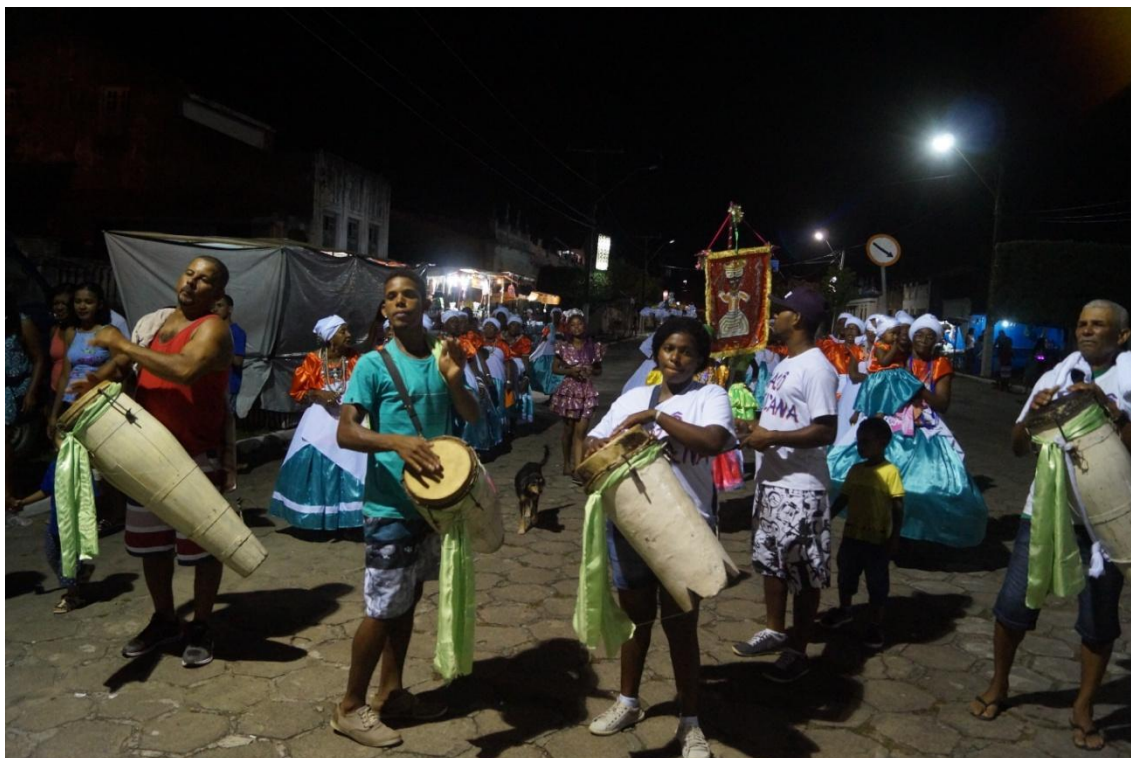
Imagem 32: Desfile das Nagôs Africanas no circuito do carnaval-2018

Segundo o Instituto do Patrimônio Artístico e Cultural da Bahia – IPAC, BA, o afoxé é definido como uma manifestação carnavalesca, o que não quer dizer que suas apresentações só ocorram no carnaval, mas por ser o carnaval o local de predominância de suas apresentações, e também o carnaval o local onde os afoxés marcaram o poder do acontecimento negro, ressignificando a festa momesca, vinda da Europa. O IPAC-BA apresenta a composição dos elementos que integram o afoxé, pelo o ritmo ijexá (ritmo percussivo tocado nos terreiros para saudar os orixás), os cânticos, as indumentárias, os instrumentos musicais e o ritual, a partir da conjunção destes itens são realizados o desfile que segue em cortejo pelas ruas dos bairros onde estão inseridos e nos circuitos oficial do carnaval 119 .