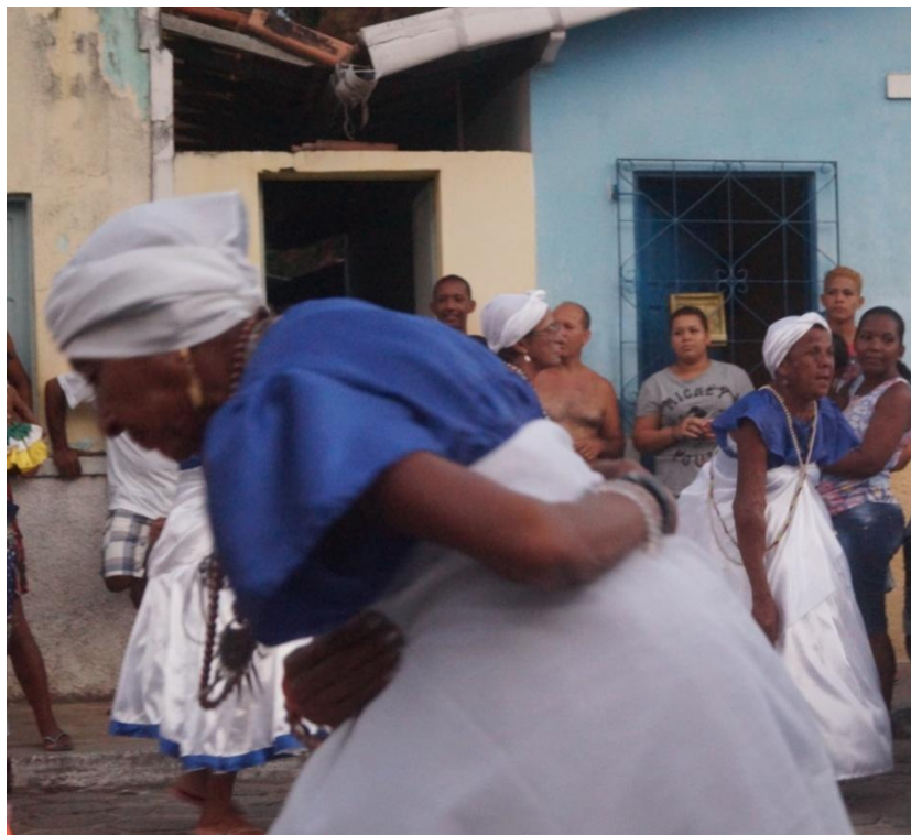
Imagem 36: A Dança das Nagôs