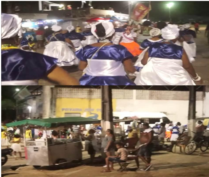
Imagem 29: Saída das Nagôs do circuito pela lateral do mercado de peixe sentido a Biela

Entoando uma chula que repetidamente dizia: Aê! Nagô vamos cortar dendê? Vamos cortar dendê Nagô, vamos cortar dendê , seguiram o seu ritual pelas ruas de Belmonte. Nesse movimento, elas cortaram a programação do carnaval, cortaram a estética do carnaval dos trios, das bandas populares, do circuito determinado pela prefeitura. As Nagôs, na terça feira de carnaval, fizeram o circuito delas, seguiram seu fluxo, iniciando o desfile nas ruas da Biela, parando e visitando algumas casas, atravessam a cidade para fazer a festa em outros bairros que o carnaval oficial não alcança. Escolhi essa seqüência de fotos porque são as que mais se aproximam do movimento de corte e fluxo.