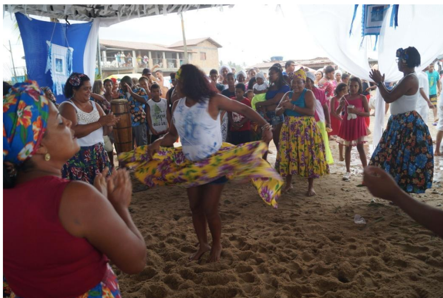
Imagem 14: Samba de roda das Marisqueiras - Festa de Iemanjá