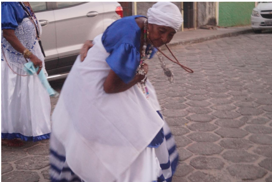
Imagem 5: Quelé dançando nas Nagôs

como é chamada pelas Nagôs. Ela reside no Bairro da Biela já há muito tempo, acompanha as brincadeiras desde o tempo em que o marido de Deza organizava. De lá pra cá não deixou mais de dançar nas Nagôs.