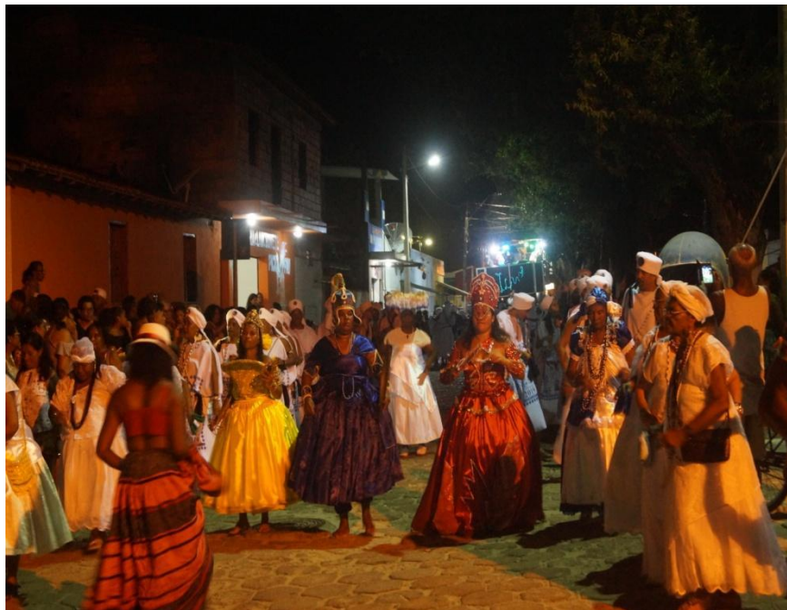
Imagem 18: Desfile dos Netos de Gandy, na Avenida Rio-Mar, sexta feira de Carnaval, abertura do carnaval de Belmonte, 01/03/2019