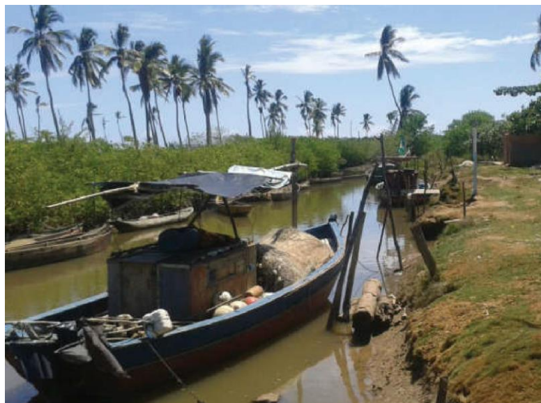
Figura 15: Imagem: Biela – Belmonte

Por conta da mariscagem e da pesca, atividades fundamentais para o sustento de algumas famílias, surgem espaços de ocupação ligados a essas práticas no núcleo urbano de Belmonte. Entre esses está o Bairro da Biela, que se constitui como um território de produção pesqueira destacando-se por abrigar a colônia de pescadores Z-21 e a Associação de Marisqueiras e Pescadoras de Belmonte. A organização destes trabalhadores e trabalhadoras colaborou significativamente para o desenvolvimento das atividades econômicas da cidade e do bairro. A atividade da pesca extrativista ou artesanal segundo o Plano de Desenvolvimento Territorial Sustentável e Solidário 58 e do Documento de Monitoramento das embarcações produzido pela Veracel Celulose, apontam que tais atividades econômicas são responsáveis pelo desenvolvimento socioeconômico da cadeia produtiva região da Costa do Descobrimento. 59