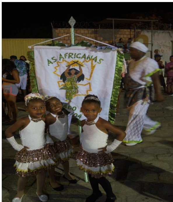
Imagem 19: As Africanas, desfile de 2018

Além de estarem atravessados pelas ancestralidades africanas, os elementos musicais do maculelê refletem muito sobre as relações afetivas existentes na comunidade em que está inserido, apresentando características de tratamento em suas músicas entre o grupo e os ouvintes. Cada música entoada tem suas designações: a música de iniciar o desfile; chegando a uma casa, é entoado o pedido de permissão para se apresentar na frente da mesma; em homenagem a pessoas importantes para a história do grupo e da comunidade; as de agradecimento pela hospitalidade; e as de louvação aos ancestrais e orixás.