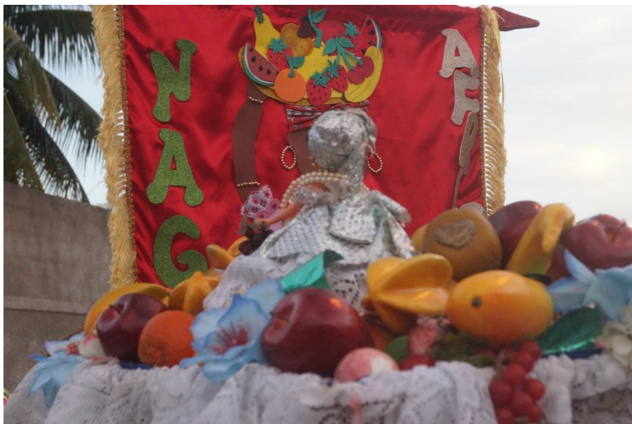
Imagem 40: Tabuleiros das Nagôs Africanas

As Nagôs tem um cuidado com o candomblé. Como é a relação das Nagôs com o candomblé já que a maioria das mulheres são do candomblé?