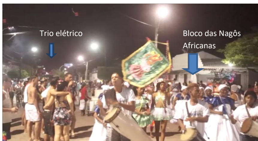
Imagem 27: As Nagôs entre o trio-Elétrico e o povo- 2019

As próximas imagens (imagem 26 e imagem 27) demonstram o movimento que as Nagôs fazem durante o carnaval. Estas imagens foram registradas na terça-feira de carnaval de 2019, dia oficial do feriado, momento em que se apresentam as grandes atrações vindas de fora e os principais blocos fechados, é também o dia em que a cidade está mais cheia de foliões devido ao feriado. Os blocos afro-carnavalescos da cidade não