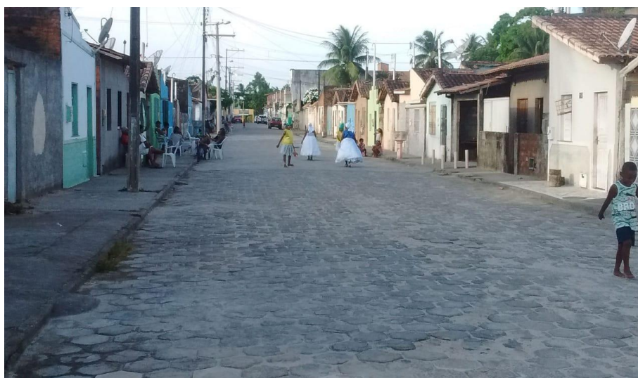
Imagem 13: Rua Floriano Peixoto - Biela

Nesta perspectiva, ao entrarmos no Bairro da Biela, logo de início, tem-se impressão de que suas ruas são semelhantes aos demais bairros populares da cidade. No entanto, após transitar por suas ruas e avenidas com um pouco mais de atenção, passa-se a perceber suas rasuras, como, por exemplo, crianças descalças brincando na rua e sendo observada pelos olhos atentos dos vizinhos sentados na porta de casa ou por aqueles que passam pela rua, tal como pode ser observado na imagem abaixo que registra o cotidiano na Rua Floriano Peixoto.