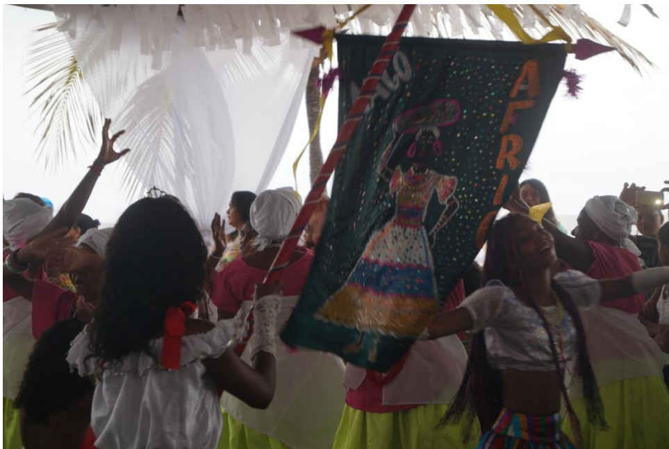
Imagem 31: Festa de Yemanjá, 4 de fevereiro de 2018

sobre seus modos de ser e de sobreviver. A imagem a seguir, registra a apresentação das Nagôs Africanas na festa de Yemanjá na beira da praia. Percebe-se que elas formaram uma roda onde cantaram, dançaram e celebraram suas religiosidades em saudação a Rainha das águas salgada.