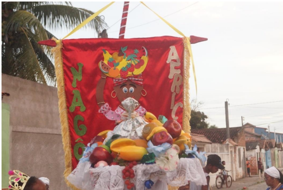
Imagem 22: As Nagôs Africanas, Sábado de Carnaval 02/03/2019.