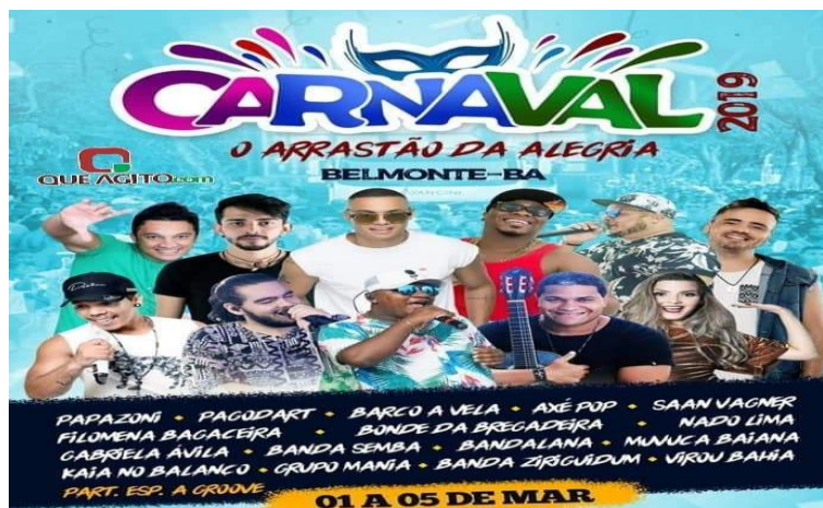
Imagem 25: Carnaval 2019- Arrastão da Alegria.