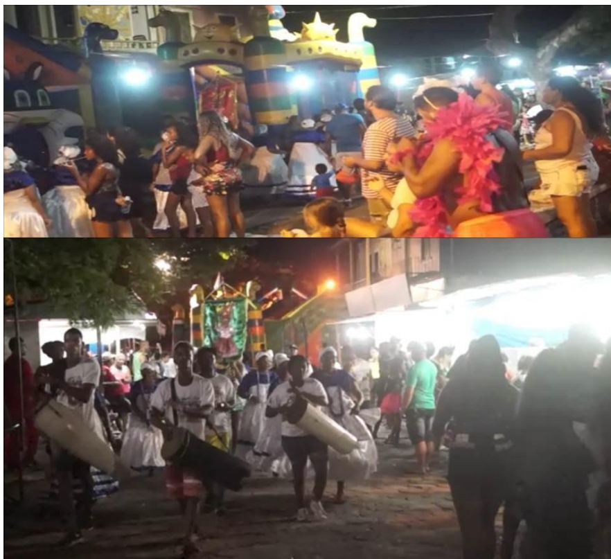
Imagem26: Chegada das Nagôs na Rua paralela ao circuito principal do carnaval