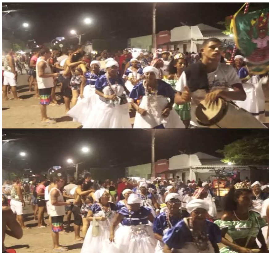
Imagem 28: Entrada das Nagôs na frente do trio elétrico

são inclusos oficialmente na programação deste dia, porém, as Nagôs burlaram a programação e fizeram o cortejo e saíram às ruas, prática feita durante todos os carnavais.