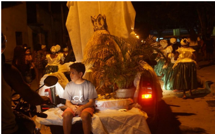
Imagem21: Altar de Omolu, desfile sexta –feira de carnaval 2019