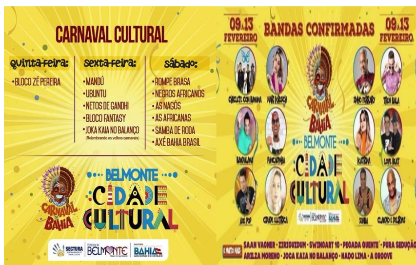
Imagem 24: Belmonte: Cidade Cultural - carnaval 2018

A cidade de Belmonte é bastante, conhecida na região por sua produção cultural e estética das camadas populares negras, fator que a prefeitura utiliza como símbolo da cultura popular local, narrativa construída principalmente nas festas carnavalescas. O tema do carnaval do ano de 2018, primeiro ano que acompanhei a festa como pesquisadora foi “Belmonte: Cidade Cultural”, como pode ser visto no material de divulgação da prefeitura da imagem 24.