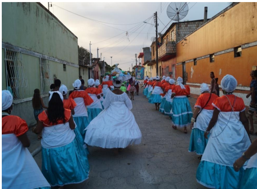
Imagem 12: Nagôs Africanas, Travessa Marquês Herval - Biela