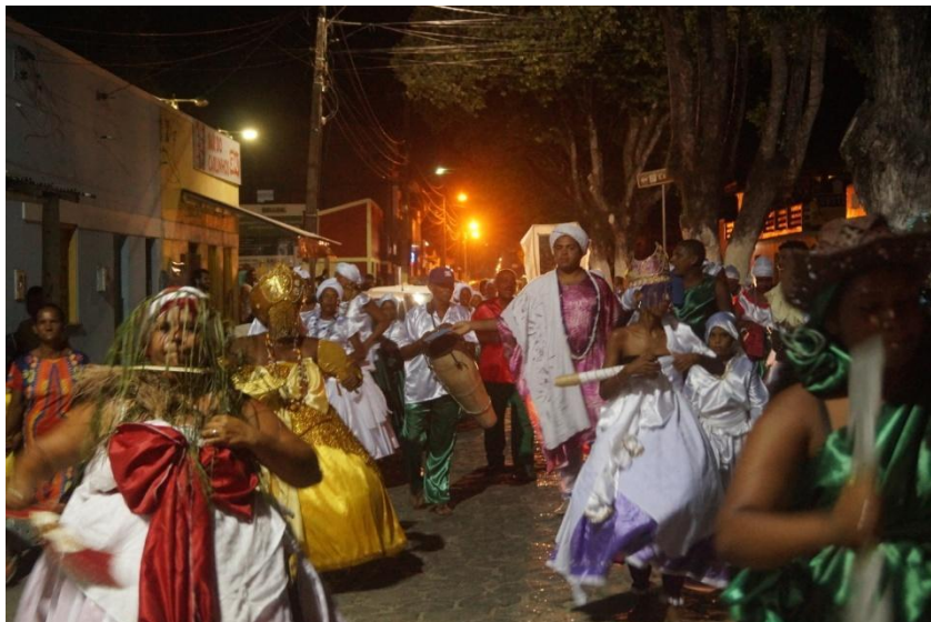
Imagem 20: Ubuntu, Carnaval 2019