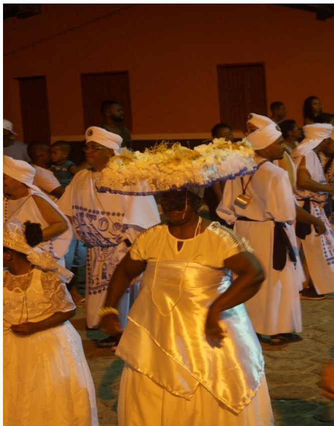
Imagem 17: Tabuleiro para Oxalá, Os Netos de Gandhi na abertura oficial do Carnaval de Belmonte, 01/03/2019