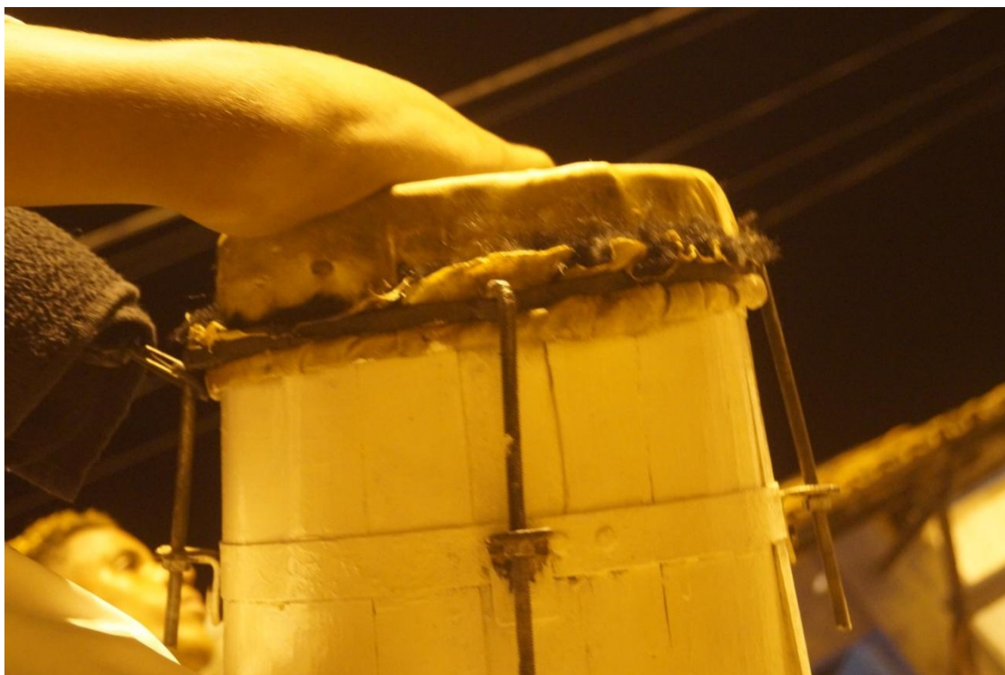
Imagem 34: Tambor das nagôs Africanas